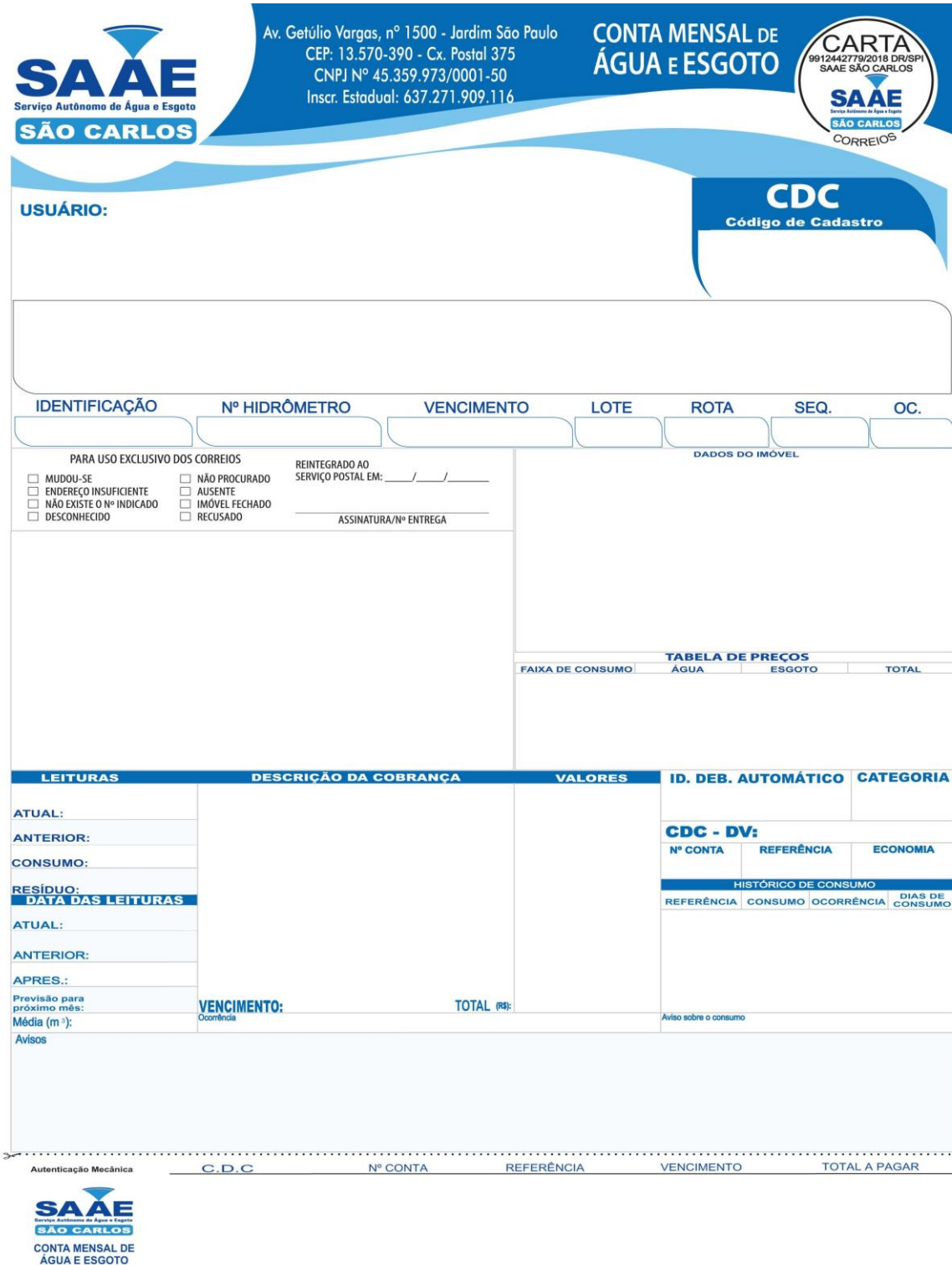
Figura 3: Frente do Formulário Com Chancela.