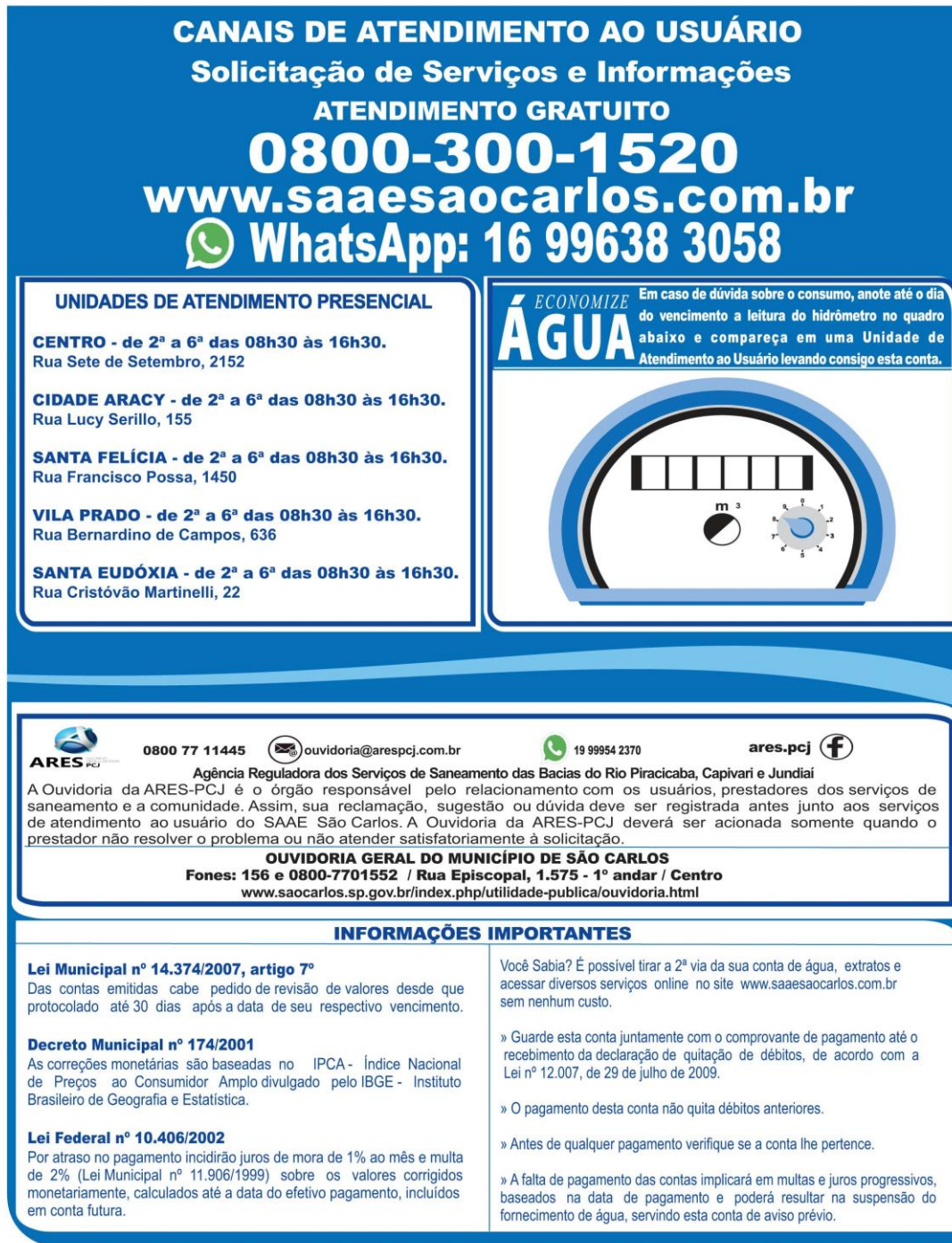
Figura 2: Verso do Formulário Sem Chancela.